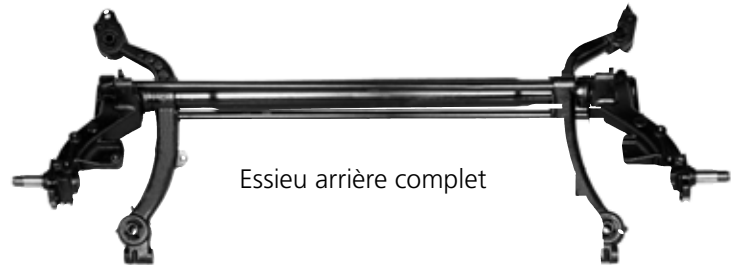
Essieu arrière complet